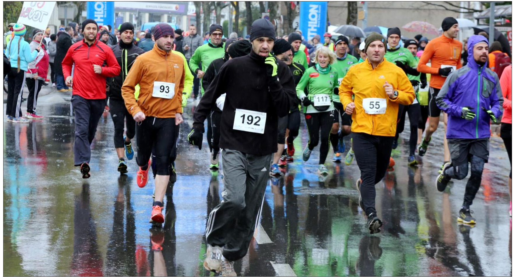
Au total, 213 concurrents se sont élancés dans les rues de Villerupt pour la Transfrontalière. L'épreuve de 15 km proposait aux participants de passer par le Luxembourg et Audun-le-Tiche, entre autres.

Les participants ont d'ailleurs apprécié l'organisation qui, pour le coup, avait mobilisé une cinquantaine de bénévoles. Sur l'aire d'arrivée, l'atmosphère était à la fête grâce aux reprises de chansons célèbres effectuées par Los Chicanos. Avant le départ, un échauffement en Zumba avait été proposé par Z-Dance. Comme pour