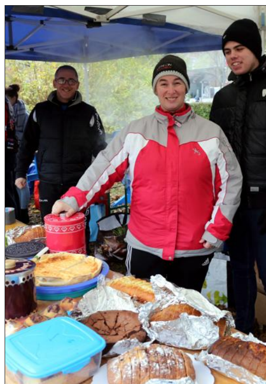
Après l'effort, le réconfort ! Les bénévoles, en grande partie du TGV54, proposaient de quoi se ressourcer après la course.